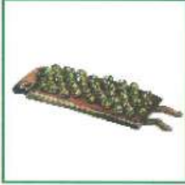
சலங் க ை