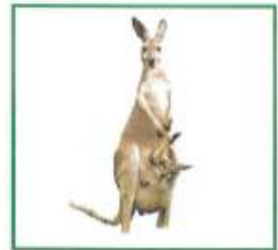
க _____ காரு