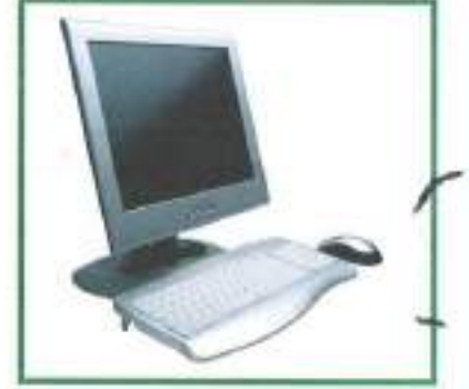
க _____ னி