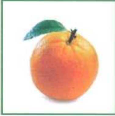
தோ _____ ம்பழம்